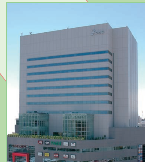
船橋フェイスビル8階