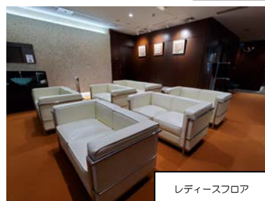
レディースフロア