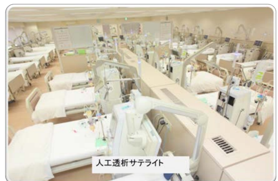
人工透析サテライト

私どもは、当然の事ながら医療の安全性を第一とし、感染対策はもとより、安全対策(機器の保守管理点検、スタッフの教育等)の的確な実施により安心して広々とした空間での透析を皆様にご提供させていただいております。