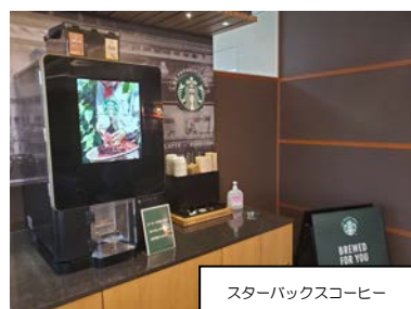
スターバックスコーヒー